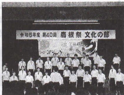
(3年合唱コンクール)