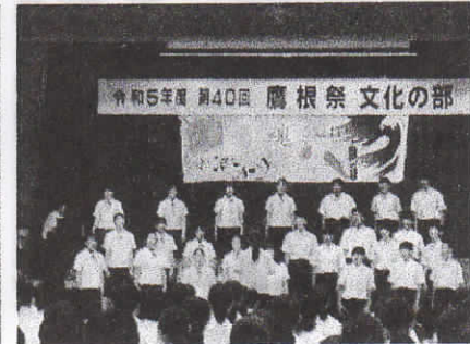
(2年合唱コンクール)