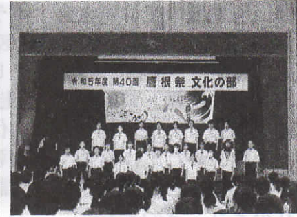
(1年合唱コンクール)