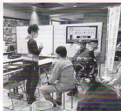
【災害ボランティアセンターを開設】

本年も社会福祉法に基づき10月1日から全国一斉に共同募金運動が実施されます。皆様の温かいご理解とご支援を賜りますよう、よろしくお願い申し上げます。